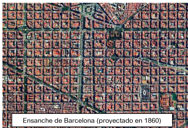
Ensanche de Barcelona (proyectado en 1860)

Para terminar, nos convertiremos en arquitectos urbanistas y trabajaremos sobre un trocito de Montecarmelo que conocemos muy bien, junto a nuestro cole. Daremos juntos un paseo para analizar las cosas que nos gustan y las que no, y, por equipos, desarrollaréis un Proyecto con vuestras propuestas. Cada equipo preparará un plano, y si alguno se atreve, incluso una maqueta, y el último día las expondremos para compartirlas con todos.