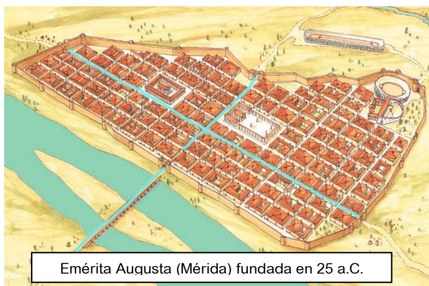
Emérita Augusta (Mérida) fundada en 25 a.C.

Después daremos un paseo por la historia para descubrir como han ido evolucionando las ciudades a través del tiempo, y os contaremos muchas curiosidades: ¿Sabíais que los romanos ya tenían pasos de peatones en sus calles? ¿o que existen ciudades con forma de avión, de estrella o de palmera? ¿o que se está construyendo una megaciudad que se extiende en línea recta a través del desierto en Arabia Saudí?